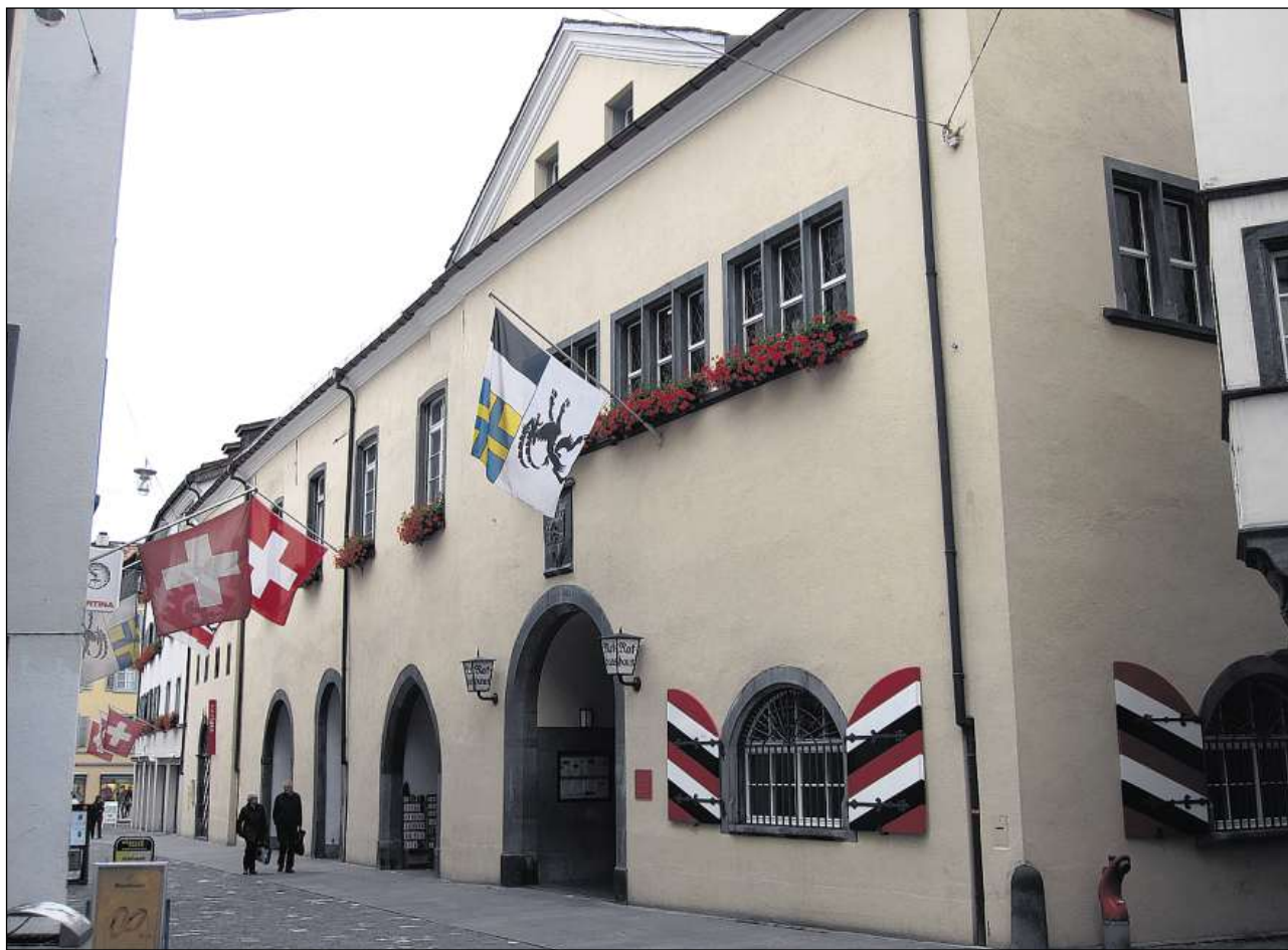
A partir dal 16avel tschientaner avevan las dietas da la Lia da la Chadé lieu regularmain en la chasa-cumin a Cuira, erigida da nov suenter l'incendi dal 1464.

Il contract d'alianza, stipulà il 1524 tranter las Trais Lias reticas, ha inizià l'epoca d'ina politica nazionala coerenta da la Republica da las Trais Lias. 63 mess represchentavan ussa 52 cumins en la Dieta federala da la Republica, 22 da quels provegnivan da 17 cumins da la Lia da la Chadé. Cuira è daventà il center da